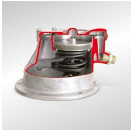
Klasyczna pompa próżniowa tłokowa (model w przekroju)

Połączone pompy olejowe/próżniowe zamontowane są w wannie olejowej.