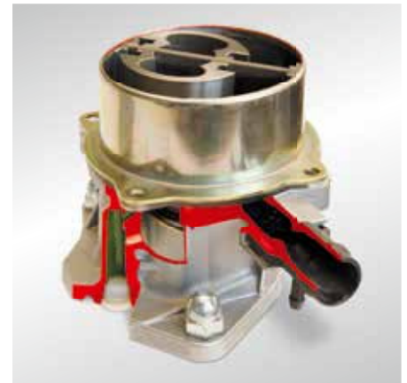
Obecny stan techniki: łopatkowa pompa próżniowa (model w przekroju)

Aby uniknąć powikłań po remoncie silnika, zalecamy z tego względu po awarii silnika odnowienie również pompy próżniowej.