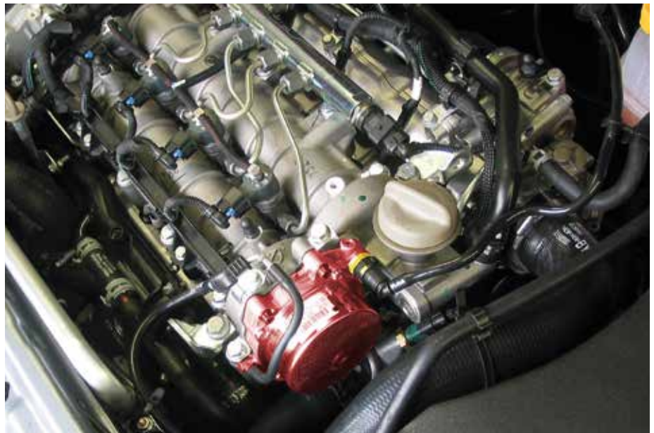
Pompa próżniowa w Oplu Vectra B (wyróżniona)

Ponieważ awaria wspomagania hamowania może prowadzić do niebezpiecznej sytuacji, pompa próżniowa pełni równocześnie rolę urządzenia zabezpieczającego.