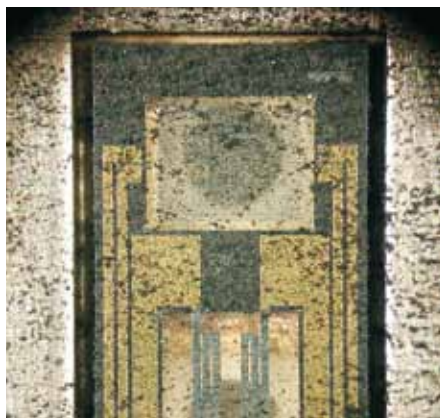
Sól i brud mogą uszkodzić czujnik przepływu powietrza – co najmniej jednak powodują nieprawidłowe pomiaru, co z kolei może wpływać na EGR.