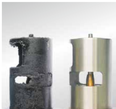
Ponieważ zawory EGR same nie mogą pokryć się sadzą, należy znaleźć przyczynę powstawania sadzy.

Niesprawny element należy zawsze wymieniać na nowy.