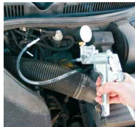
Pneumatyczny zawór EGR lub jak tutaj przetwornik elektropneumatyczny: za pomocą ręcznej pompki podciśnienia w prosty sposób można sprawdzić działanie.